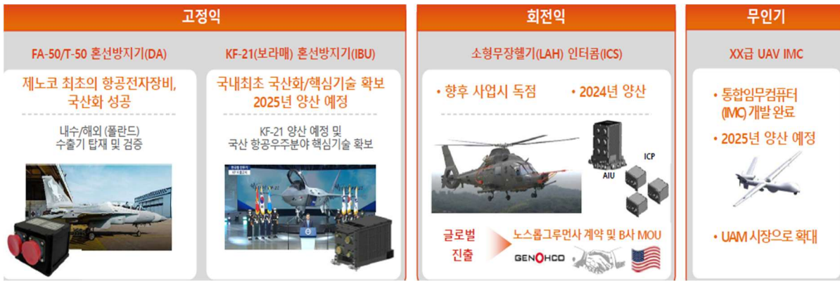
그림 1. 항공전자 제품 라인업