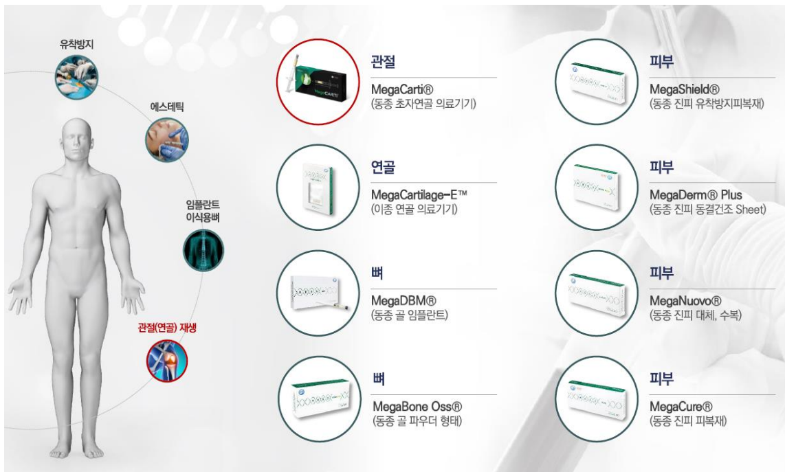
그림 2. 엘앤씨바이오 제품 포트폴리오