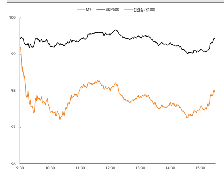
그림 1. M7과 S&P500의 장중 주가 변화 흐름